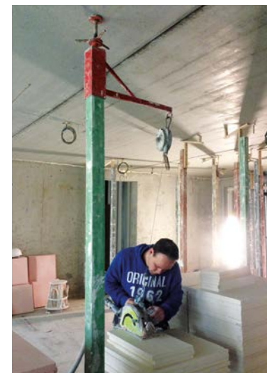
Pakketten met gipsblokken

Naast de risico's van fysieke belasting, is stof ook een risico bij het zagen van gipsblokken. Het is daarom belangrijk om altijd (met of zonder gebruik van de zaaghulp) goede afzuiging te gebruiken.