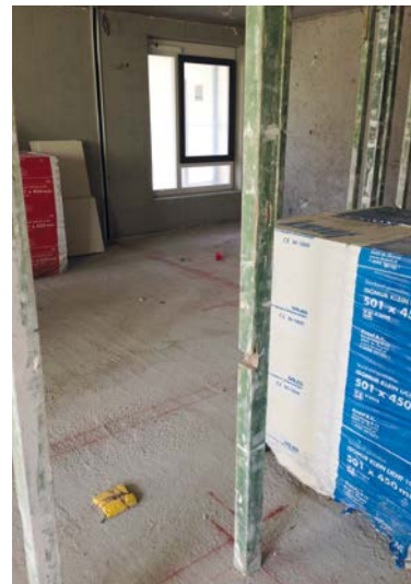
Pakketten met gipsblokken

Op de vloer wordt de positie van de muren afgetekend. Dan kan gestart worden met het plaatsen van het eerste blok. De blokken worden aan de bovenkant en zijkant gelijmd en naast elkaar geplaatst totdat de volledige lengte is bereikt. Dan wordt gestart met de volgende rij blokken, waarbij het laatste afgezaagde deel, het eerste blok is van de volgende rij. Ruim twee derde van de geplaatste blokken moet op maat gezaagd worden.