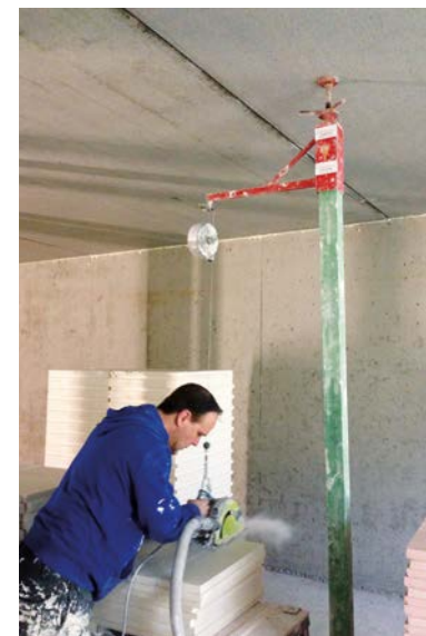
De zaaghulp in gebruik