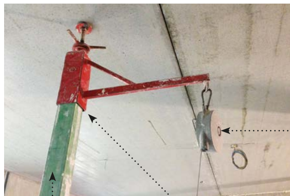
Balancer waar zaag aan opgehangen wordt

De zaaghulp is een hulpmiddel om de zaag 'gewichtsloos' te gebruiken. Omdat de zaag aan een balancer hangt die aan de zaaghulp is bevestigd, wordt het gewicht van de zaag sterk gereduceerd. Gemiddeld zijn er zo'n 150 zaagbewegingen per dag. Het verminderen van het gewicht van de zaag levert dus een aanzienlijke vermindering van de fysieke belasting op.