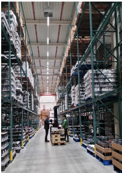
Een student is hier bezig met zijn examen

Omdat de studenten de overstap van 5 dagen in de schoolbanken naar 4 dagen werken als intens en fysiek zwaar ervaren, heeft Sligro besloten om ze al tijdens de stage te trainen in arbeidsmotoriek en niet te wachten tot ná de vaste aanstelling. Zowel de studenten als Sligro als werkgever hebben hier profijt van. Normaliter krijgen de werknemers van Sligro een interne basisopleiding arbeidsmotoriek bij een vaste aanstelling.