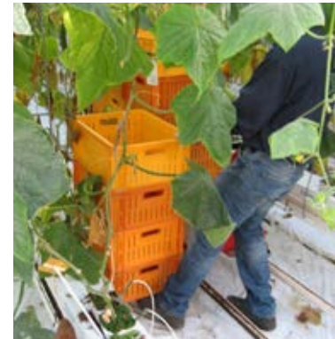
De kisten op de voet laten steunen om een rij te kunnen verplaatsen

Dit was het nadeel van het oude systeem. Het omstapelen vergt kracht (tillen en verplaatsen van