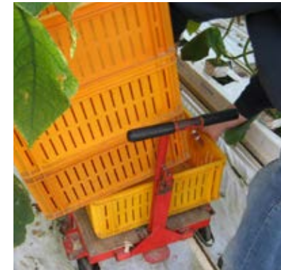
Het verplaatsen van de kisten door deze zijwaarts op te schuiven