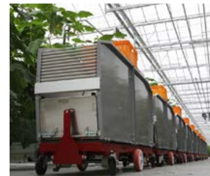
De aan elkaar gekoppelde containers met de extra kist er boven op