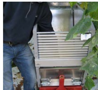
Werkhouding met het nieuwe systeem