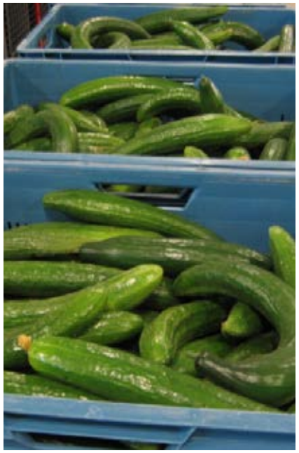
Blauwe kisten met industriële komkommers

"Wat kan bedrijven tegenhouden? De marges voor komkommers zijn erg laag, bedrijven letten dus sterk op de kosten. Op dit moment zullen bedrijven dan ook niet snel investeren als daar geen concrete aanleiding voor is. Subsidies zouden bedrijven hierbij kunnen helpen. Het aangaan van een ontwikkelproces van een dergelijk systeem kost tijd. Bedrijven dienen bereid te zijn hier in te investeren, maar dan levert het uiteindelijk ook iets op."