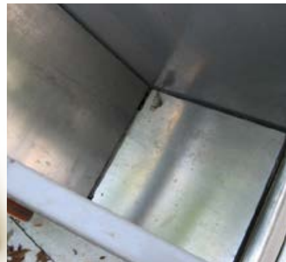
De schuif in de bak

Op een nieuwe kar staan twee containers waarin elk 275 komkommers passen, dat zijn in totaal 550 komkommers. Uitgaande van 400 gram per komkommer is het totaalgewicht 220 kg plus 50 kg van de kar maakt 270 kg. De containers hebben een dusdanige capaciteit dat zelfs met een maximale productie met paden van 100 meter deze nog groot genoeg zijn. Bovenop de twee containers kan een extra bak