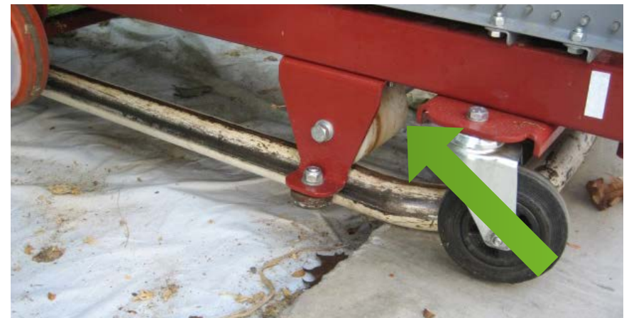
Loopwiel met extra diameter

het vullen van de container tijdens het oogsten. Daarnaast is er een loopwiel met extra diameter onder de container geplaatst zodat deze makkelijker en lichter rijdt (zie pijl op de foto). Medewerkers zijn intensief betrokken geweest bij het testen in de praktijk voordat het uiteindelijke ontwerp in productie is genomen. Uiteindelijk zijn er nu 108 bakken en 50 onderstellen in het bedrijf aanwezig."