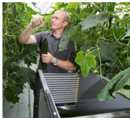
Het oogsten van de komkommers

Vervolgens pakt een kraanmechanisme een container op en zet deze op een rollenbaan