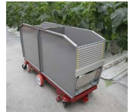
De kar met twee containers